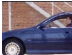
Progressif, toutes les lignes sont affichées en même temps

Le balayage progressif est utilisé à la place du balayage entrelacé dans caméras CCTV analogiques (PAL/NTSC). Grâce au balayage progressif, tous les pixels (lignes) sont capturés au même moment, ce qui permet d'afficher des images en mouvement sans déformation.