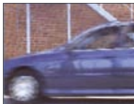
Entrelacé, un décalage entre lignes paires et impaires altère la qualité des images